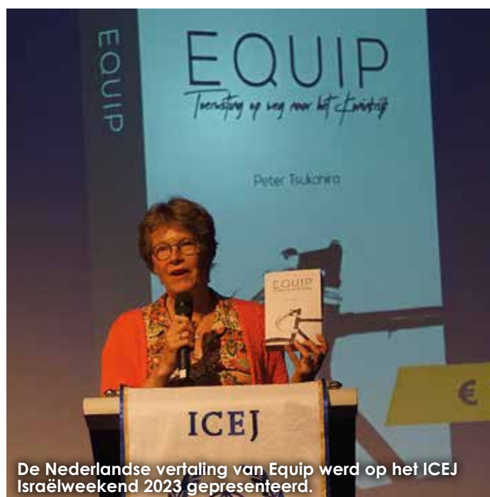
De Nederlandse vertaling van Equip werd op het ICEJ Israëlweekend 2023 gepresenteerd.

Het boek is te bestellen op www.icej.nl/boeken