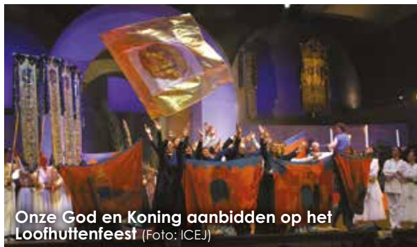
Onze God en Koning aanbidden op het Loofhuttenfeest

Psalmen. Zo'n veertig Psalmen verklaren Hem als de opperste Heerser, volledig op de troon, als Koning van de gehele aarde (Psalm 47), en in de hemel (Psalm 11:4), over Jakob (Psalm 59:13) en over de volken (Psalm 22:28). De Psalmisten begrepen dat deze Koning, die ook verheven is als Schepper van hemel en aarde, de volledige controle heeft over de zaken van deze wereld.