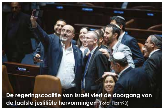
De regeringscoalitie van Israël viert de doorgang van de laatste justitiële hervormingen

Een recent opinieartikel vergeleek de huidige situatie ook met de Jom Kipoer-oorlog precies 50 jaar geleden, toen het moderne Israël geconfronteerd werd met zijn grootste existentiële dreiging. De columnist merkte echter op dat het verschil deze keer is dat het geen plotselinge, verrassingsaanval is, maar dat beide partijen met hun ogen wijd open een ramp tegemoet lopen.