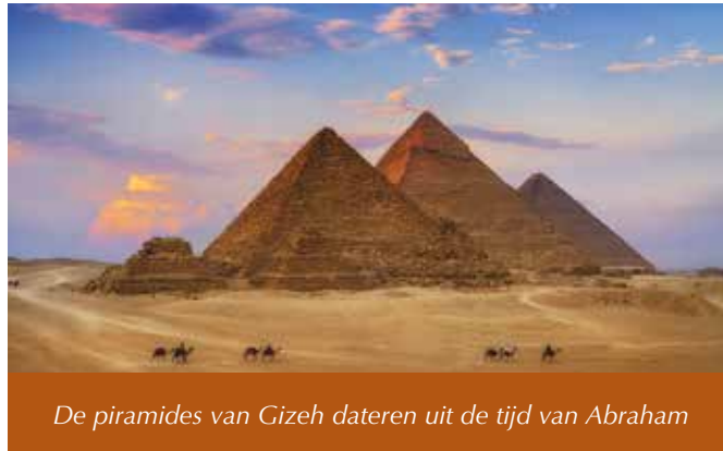
De piramides van Gizeh dateren uit de tijd van Abraham