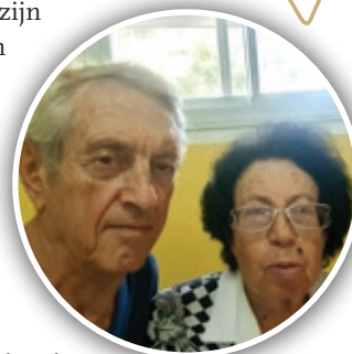
Een delegatie uit Duitsland op bezoek tijdens het Loofhuttenfeest.