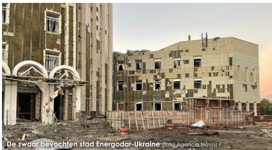
De zwaar bevochten stad Energodar-Ukraine

We weten welke roeping we hebben, om te troosten, speciaal in deze tijd van nood. Velen die aankomen uit Oekraïne en Rusland lijden onder trauma en emotionele pijn. Israël heeft de uitdaging om erop in te gaan met de juiste hulp. De uitdaging voor ons in de naties is om te bidden en te geven, om deel te zijn van deze urgente en toenemende Aliya. 🌍